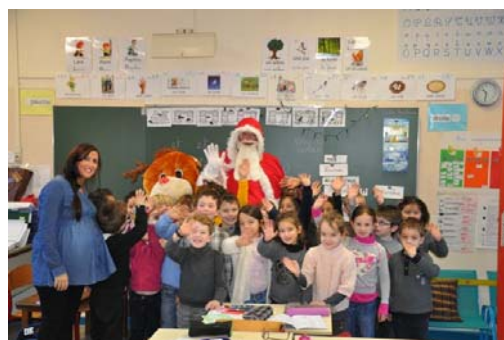
L'équipe de l'APEL

Nous avons, cette année encore, partagé de vrais et beaux moments avec tous les enfants.