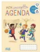
Mon incroyable agenda de chez MDI