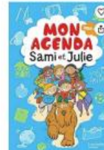
Mon agenda 2026-2027 «Sami et Julie» de chez Hachette

TOUTES CES FOURNITURES (CHAQUE CRAYON, CHAQUE VETEMENT...) DOIVENT ÊTRE MARQUÉES AU NOM DE L'ENFANT